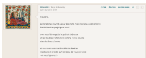
Doc. 4 – Capture d'écran du forum FINAMOR.

– FINAMOR comme masque : FINAMOR n'est utilisé que pour anonymiser un poème, et fonctionne à la manière d'un masque de carnaval. Dans ce premier cas, le « je lyrique » est assimilable à un membre du forum distinct de FINAMOR, grâce à des indices biographiques qui permettent de l'identifier. Dans l'exemple ci-dessous, l'utilisation du surnom « Claudine » identifie par contrecoup le scripteur, seul membre du forum à surnommer ainsi la récipiendaire. C'est le degré zéro de l'investissement scriptorial du dispositif, puisqu'il fait de FINAMOR un intermédiaire purement technique.