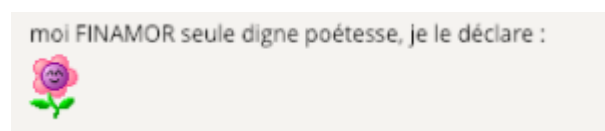
Doc. 5 – Capture d'écran du forum FINAMOR.

– FINAMOR comme personnage distinct : tous les poèmes ne contenant ni biographèmes ni indices de l'identité du scripteur ou du destinataire sont par défaut des poèmes assumés par FINAMOR, comme sujet lyrique universel. Parmi eux, une sous-catégorie raffine le procédé en donnant des biographèmes assimilables à FINAMOR comme personnage, ou en introduisant la signature dans le corps du texte, comme c'est le cas ici :