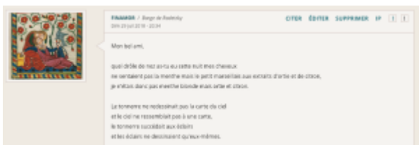
Doc. 21 – Capture d'écran du forum FINAMOR.

C'est à partir du 29 juillet 2018 que s'enclenche un véritable polylogue poétique, prenant pour point d'appui un poème lyrique très classique dans sa situation d'énonciation : un énonciateur masculin hétérosexuel déclare sa flamme à une destinataire féminine, à l'aide de force métaphores convenues. Les cheveux de la muse, « amie grave et légère », sentaient « la menthe fraîche et la nuée d'orage » tandis que, marqueur temporel, « le tonnerre redessina la carte du ciel » ; la femme dansait « une Valse de Shostakovich en descendant du lit ». Tout cela enveloppe la situation de brumes romantico-surréalistes qu'un poème posté la nuit suivante vient dissoudre en les aplanissant :