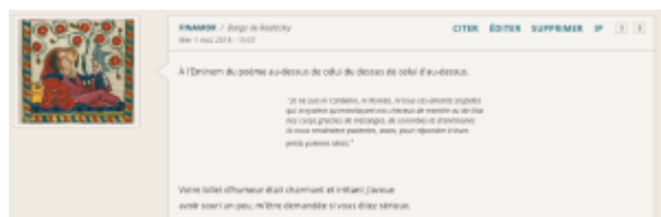
Doc. 23 – Capture d'écran du forum FINAMOR.

Le lecteur s'insinue jusque dans la diégèse poétique ; ce n'est pas là une attitude inédite sur le forum, où nombre de retours sur les poèmes s'effectuent sous forme de textes poétiques à fonction critique, voire corrective. Le topic prolonge cette conversation sur sept poèmes, et rend compte de la complexité de l'intrication des systèmes d'adresse et de réponse sur les topics polylogaux de forum, où les citations de messages précédents viennent clarifier les choses, comme dans ce poème qui cite entre guillemets et en italiques un poème placé deux messages plus haut, mais qui pourtant est adressé à l'énonciateur d'un poème placé encore plus haut :