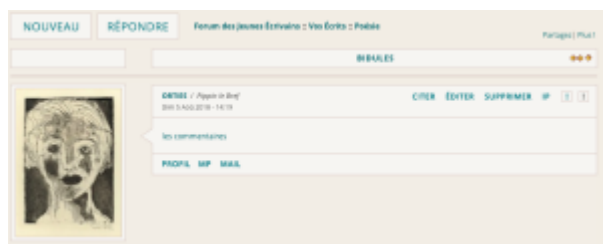
Doc. 19 – Capture d'écran du forum FINAMOR.

– la tendance minimaliste, où le post se compose d'un simple lien vers les commentaires :