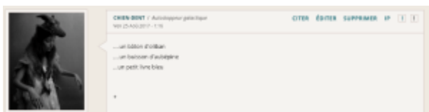
Doc. 20 – Capture d'écran du forum FINAMOR.

FINAMOR n'exploite pas cette hétérogénéité médiatique, mais le même type de rapport existe cependant entre les posts qui composent son fil : on peut parler, grâce à la diversité des contributeurs, d'une hétérogénéité stylistique, thématique et énonciative. Mais cette hétérogénéité, plutôt naturelle dans le cadre d'un projet collectif au sein duquel les textes pris individuellement ne sont pas écrits à plusieurs, se double de jeux d'échos et de renvois, qui réinstaurent une forme de polylogue dans le topic. Là où les écrivains du forum avaient produit des topics qui bannissaient cette forme de conversation, FINAMOR réintroduit dans la section bibliothèque du forum la possibilité d'une dialogue entre textes. Nous avons déjà abordé le topos de la signature et les poèmes hypertextuels. Existente aussi les reprises et modulations d'images poétiques ; le 1 décembre 2018, FINAMOR insère dans un poème : « vous parlez si bien de mon buisson d'aubépine », et le 4 janvier 2019, dans un autre : « c'est une adorable personne qui a dans son jardin un buisson d'aubépine ». Ce motif est d'ailleurs une réponse au topic « Orbes » de chien-dent, où il est installé parmi d'autres objets de rituel :