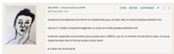
Doc. 16 – Capture d’écran du forum FINAMOR.

Ce petit jeu n’est d’ailleurs pas réservé aux seuls poèmes ; il faut que les lecteurs entrent en scène pour que la mystification prenne corps, comme le fait art.hrite en feignant de se découvrir seul bénéficiaire de tous les poèmes, pastichant discrètement l’érotomanie lectoriale :