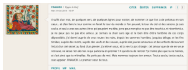
Doc. 6 – Capture d'écran du forum FINAMOR.

– FINAMOR comme énonciateur lyrique collectif : cette utilisation est apparue plus tardivement, comme si elle était le fruit d'un imaginaire de FINAMOR qui avait eu besoin de sédimenter pour donner aux scripteurs des idées plus raffinées du personnage. Ce chant d'amour à plusieurs voix se matérialise dans des textes où le « je lyrique » s'écrit en langue inclusive :