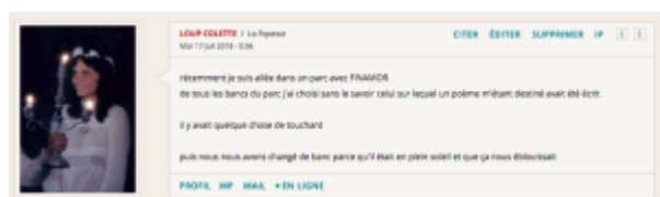
Doc. 3 – Capture d'écran du site FINAMOR.