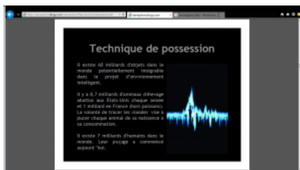
Doc. 1 : Extrait de Ewenn Chardonnet, « Animisme industriel », copie d'écran (consulté le 01/07/2016).

représentés par les extra-terrestres ou les immortels. Sans surprise majeure, soit ils entrent dans notre monde, et c'est alors fort angoissant pour notre intégrité, soit nous pénétrons chez eux, dans un autre monde plus si virtuel, et cette fois la bascule s'opère en direction du merveilleux. La première option relève de l'imaginaire spectral du « fantôme dans la machine » et, le fantôme présentant une forte tendance à aspirer à la corporéité ou à surgir dans le monde réel pour nous imposer sa hantise, cette image empruntée au genre fantastique sert à transposer de façon privilégiée un ensemble d'angoisses liées aux prophéties transhumanistes : peur de devenir des machines ou bien les pompes à énergie des machines ( Matrix toujours), d'un avenir fait de clones ou d'humains asservis à des Intelligences Artificielles infiniment puissantes. Sous le titre « Animisme industriel », l'artiste Ewenn Chardonnet développe un projet dont l'objectif est d'alerter contre les projets transhumanistes et la « transparence » en fait totalitaire de technologies invasives comme la maison intelligente ou le puçage.