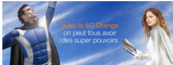
Doc. 2 : Image publicitaire

Plus largement les filaments verts lumineux qui symbolisent partout la « fibre optique » mêlent le code couleur techno-Matrix avec des courbes et des pulsations beaucoup plus organiques, qui évoquent celles des ondes de magie traditionnellement figurées par des flux de particules lumineuses.