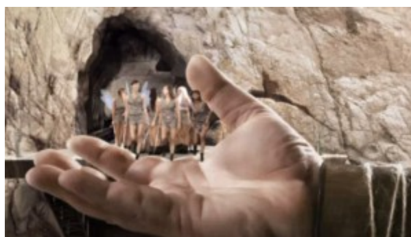
Doc. 4 : Image publicitaire