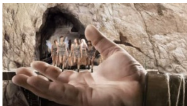
Doc. 4 : Image publicitaire