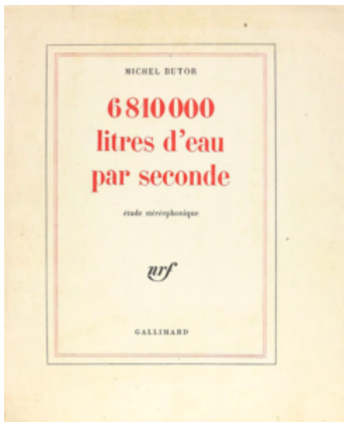
Doc. 4 – Michel Butor, 6 810 000 litres d'eau par seconde , étude stéréophonique, Paris, Gallimard, 1965.

Le domaine sonore comprend d'ailleurs des centaines d'émissions radiophoniques, avec de très nombreux entretiens, mais aussi de très nombreuses expérimentations de natures diverses, cachées dans les archives de diverses radios, qu'il fallait explorer. « J'aime la musique parce que j'ai des oreilles, et j'aime la peinture parce que j'ai des yeux », affirmait Butor dans « Bonsoir », une émission télévisuelle grand public dont il était l'invité le 6 avril 1987 sur la TSR (Télévision suisse romande). Et il est clair qu'il n'a eu de cesse de pousser l'exercice de la littérature non seulement du côté du visible (livres d'artistes, typographie, etc.), mais aussi du côté de l'audible, selon une pratique qui explore sans cesse les propriétés proches à chaque médium, tout en développant des œuvres qui ne pourraient être véritablement complètes qu'en rendant compte de leur caractère intermédiaire.