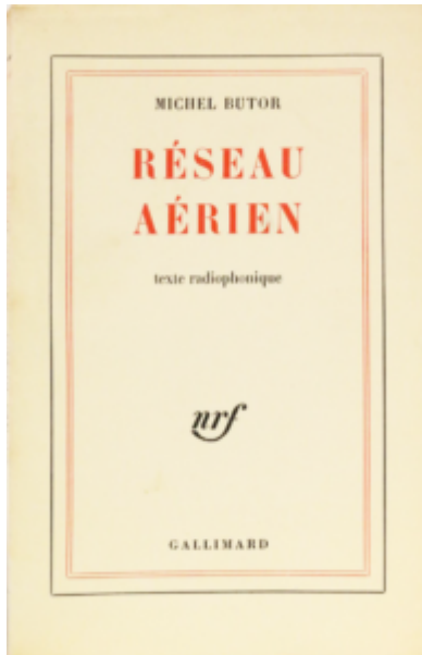
Doc. 3 – Michel Butor, Réseau aérien , texte radiophonique, Paris, Gallimard, 1962.