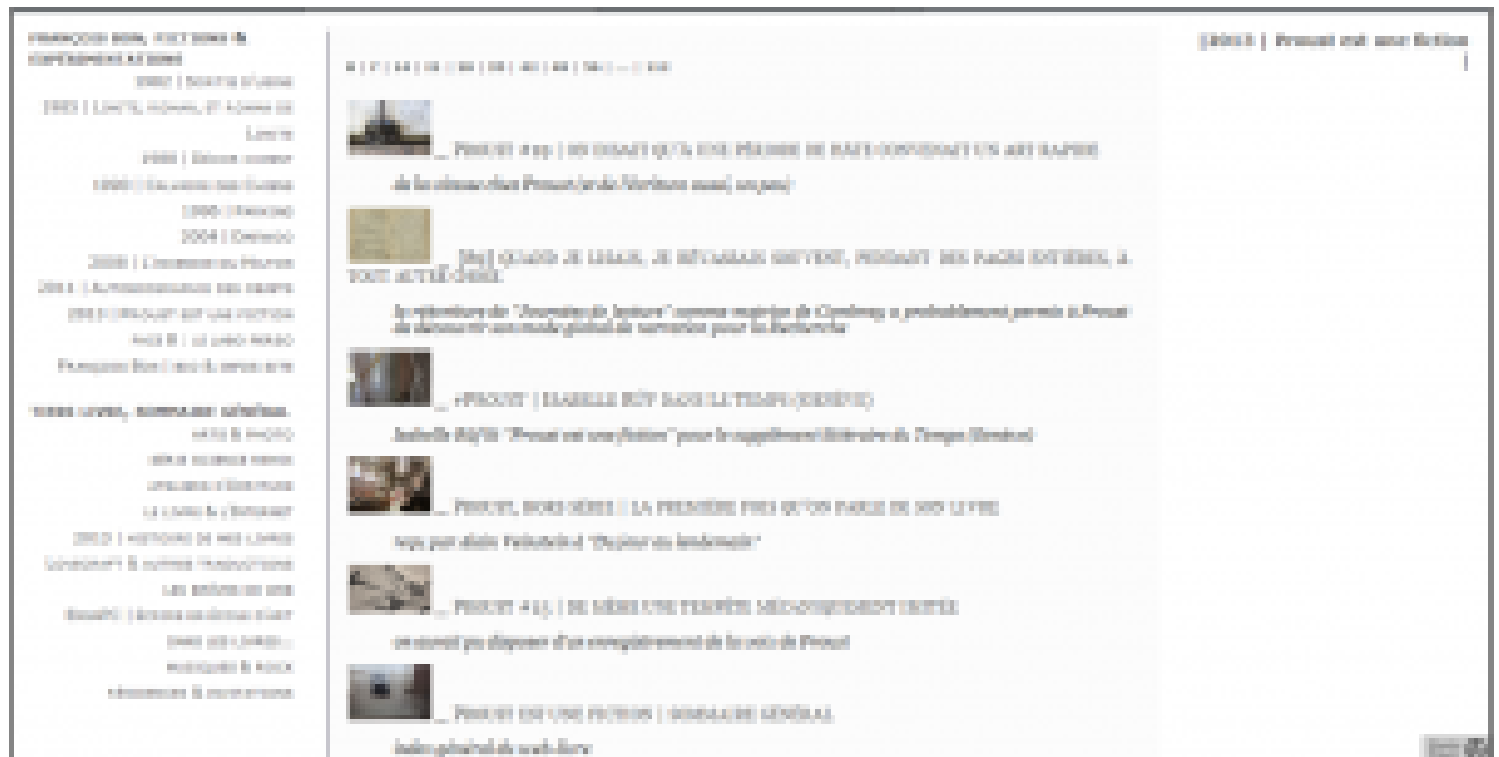
Doc. 3 et Doc. 3 bis - Captures d'écrans du Tiers livre effectuées à deux dates différentes : ci-dessus le 30 novembre 2013, ci-dessous le 25 août 2014.

Le projet Proust est une fiction débute par un premier billet posté le 17 novembre 2012 dans la section centrale du Tiers Livre. Le centième billet, quant à lui, paraîtra le 10 février 2013. Les dix premiers billets sont publiés dès les premiers jours de l'expérience, après quoi ils seront postés quasiment quotidiennement, dans un exercice journalier d'écriture à contrainte. En novembre 2013 [23], la série appartient à la section du site intitulée « françois bon, fictions & web-livres ». Il est à noter que, lors du colloque François Bon à l'œuvre qui a eu lieu les 29 et 30 novembre 2013 à Montpellier, la section était appelée « françois bon, fictions & expérimentations ».