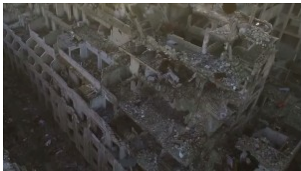
Doc. 4 - Les Films du monde , Frank Smith, cinétract 31