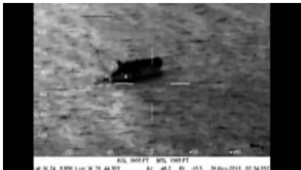
Doc. 3 – Frank Smith, Les Films du monde , cinétract 6