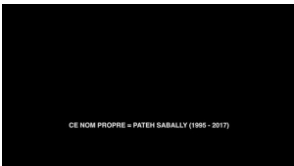
Doc. 1 et 2 - Les Films du monde , Franck Smith, cinétract 24

Les Films du monde déploie ainsi une série de textes poétiques pour approcher quelque chose que des images numériques trouvées ici et là sur les réseaux sociaux ont imprimé, mais qui peine