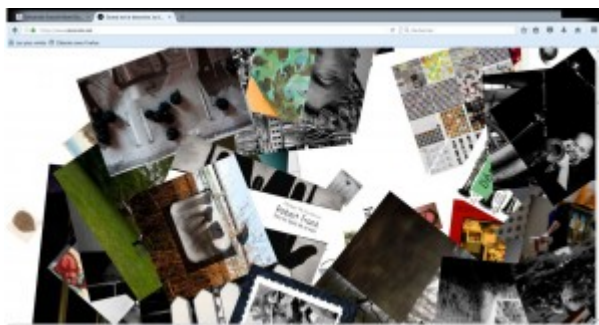
Doc. 6 - Page d'accueil du site « Désordre » de Philippe de Jonckheere ( https://www.desordre.net/ ), le 6 août 2016.

Cette tension est diversement gérée sur les blogs littéraires. Certains parient plutôt sur le surgissement : le poème du jour apparaît dès l'accès à la page d'accueil de Gammalphabet, il faut dérouler longuement celle-ci pour découvrir enfin le blogroll , menu latéral où sont listées d'abord les billets les plus récents, ensuite les différentes séries poétiques dans lesquels ils sont réordonnés. Sur la page d'accueil du site « Désordre » de Philippe de Jonckheere, des photos sont jetées en vrac (tas épars remélangé à chaque navigation), sur lesquelles il faut cliquer pour accéder à une série qu'on peut alors dérouler chronologiquement, mais sans jamais pouvoir visualiser une architecture d'ensemble du site [25].