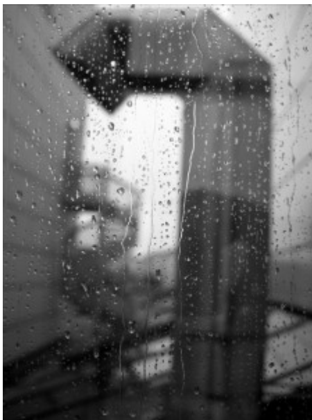
OLYMPUS DIGITAL CAMERA

Dans le poème de J.-Y. Fick se déploie un petit diptyque qui oppose un ciel d'aube à l'obscurité du fleuve, étrangement unifié par un picotement pâlisant d'étoiles. Or le commentaire est surtout sensible à cet émiettement, qu'il accentue, et transpose sur le plan sonore (dans l'image et l'allitération généralisée en r). Ce rebondissement est peut-être inconsciemment stimulé par la photographie postée le même jour par Jean-Yves Fick (sans lien direct avec le poème) et intitulée « Machiner la pluie - totem urbain 1 », où des architectures urbaines floutées par la double médiation, qui écrase la perspective, d'une vitre et de la pluie, donnent l'illusion d'un visage stylisé. Si le lien entre le commentaire (qui se rapporte au poème) et l'image (laissée sans commentaire), n'est pas délibéré, en dépit des jeux de miroirs et de délitements qu'ils partagent, l'architecture de la page dessine l'habituel carrefour qui appelle le surgissement d'autres rencontres, et peut-être, de nouvelles fulgurances, avec les autres interventions sollicitées, concernant le même poème (« Laisser votre commentaire »), ou répondant au premier commentaire (« Répondre »), ou renvoyant aux poèmes précédant (« Machiner la pluie - totem urbain 1 ») ou suivant (« infime - 113 »).