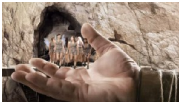
Doc. 4 : Image publicitaire