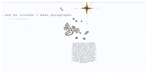
Doc. 1 – Capture d'écran 1 « page titre » www.luckysoap.com

Qu'est-ce que la « poésie numérique » ? D'après le site Epoetry la poésie numérique a recours à l'ordinateur dans son écriture, comme dans sa lecture bien sûr, et marque sa différence dans la mesure où elle ne peut être imprimée sans se dénaturer. Si la référence au terme « numérique » est claire dans la présentation faite par le site Epoetry , l'idée de poésie est présentée comme allant de soi, évidente. Il reste que l'œuvre numérique, en bouleversant la relation au texte, risque de remettre en cause toute conception préalable de la poésie.