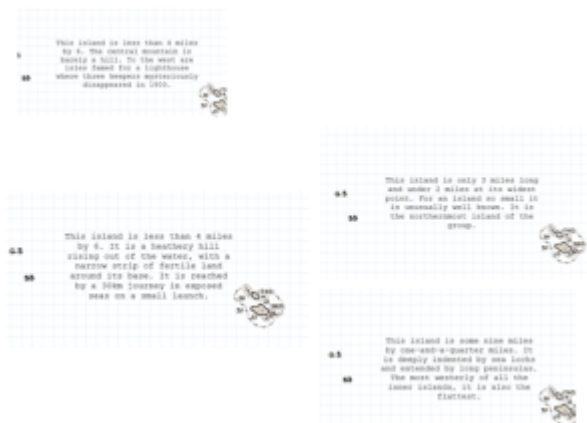
Doc. 10 – Captures d'écran : « the island is »

permanence de la localisation d'un point fixe. Il s'agit bien d'une figure poétique qui, par le dispositif textuel, nous montre une réalité différente, bien loin d'une quelconque mimesis .