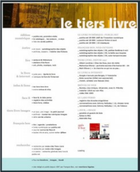
Doc. 11 – Page d'accueil de Tiers Livre, décembre 2011.