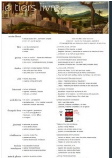
Doc. 15 – Page d'accueil de Tiers Livre, octobre 2013.

Second renversement, ce que j'appelle la logique asymptotique : il y a un principe de profusion, de multiplication d'expériences et de modes d'écriture qui tiennent toutes ensemble (journal image, notation, texte en écriture, en reprise d'écriture, etc.). L'asymptote est ici métaphore de l'infini, comme le site, lui, ne cesse de se multiplier, de se re-configurer. Comment, dans cette circonstance du mouvant, tenter une morphologie ? En faisant appel à une branche des mathématiques qui a eu son heure de gloire à la fin des années 1960 et 1970, la morphogenèse. Il ne s'agit certes pas d'entrer dans des considérations mathématiques dont je ne suis pas capable, mais de saisir par la métaphore des éléments de la démarche, pour décrire des topologies instables et penser la dynamique instable.