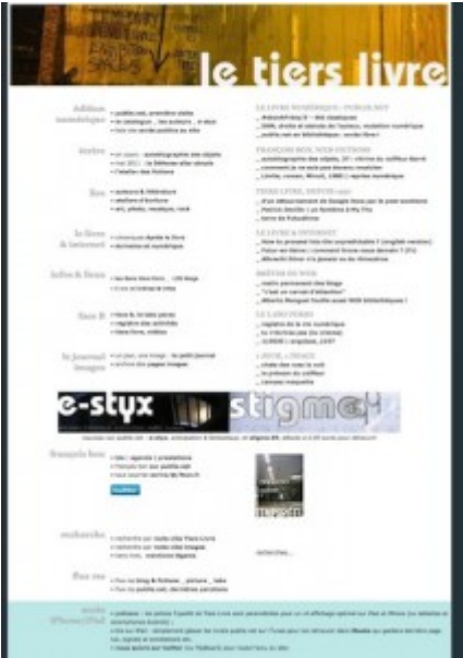
Doc. 10 – Page d'accueil de Tiers Livre, juin 2011.