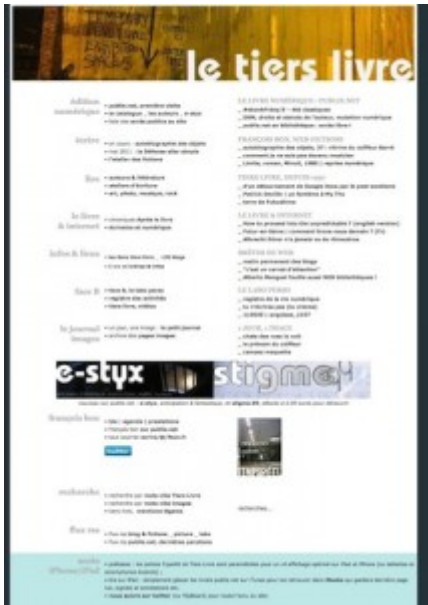
Doc. 10 – Page d'accueil de Tiers Livre, juin 2011.