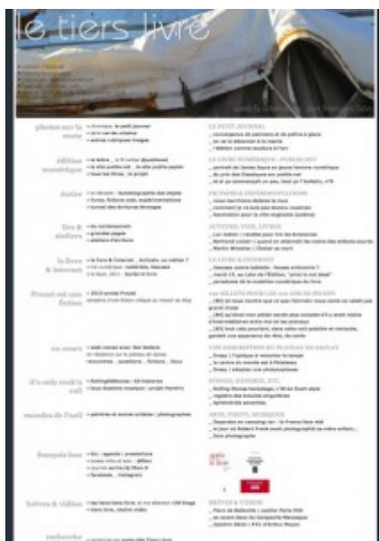
Doc. 13 – Page d'accueil de Tiers Livre, décembre 2012.