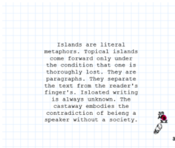
Doc. 5 – Capture d'écran : page d'accueil du site

Il ne nous semble pas inutile ici de convoquer la notion de « lyrisme [19] », tant de fois mise à contribution lorsqu'il s'agit de définir le genre poétique.