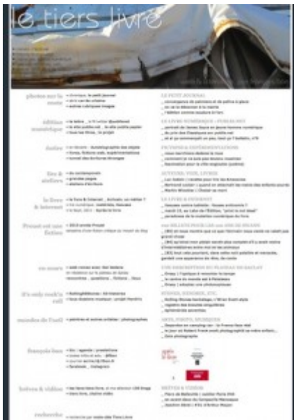
Doc. 13 – Page d'accueil de Tiers Livre, décembre 2012.