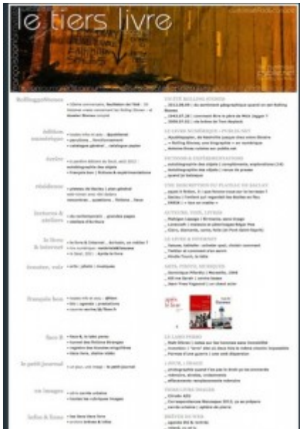
Doc. 12 – Page d'accueil de Tiers Livre, juillet 2012.