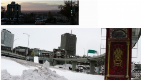
Doc. 7 – Capture d'écran de Tiers Livre, « Québec, adieux | 5, une démolition », en ligne ici.

Par cette multiplication des focales, Bon fait apparaître la partition politique et les intérêts économiques qui gouvernent le paysage urbain. La dernière image accentue symptomatiquement la séparation entre deux mondes, celui de l'autoroute escamotant l'église. Cette poursuite mélancolique d'un lointain dans le proche témoigne d'une persistance auratique dans le montage des reproductions iconiques.