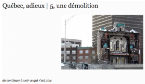
Doc. 6 – Capture d'écran de Tiers Livre, « Québec, adieux | 5, une démolition », en ligne ici.

Le Tiers Livre nous fait migrer sur son site d'un « monde parallèle » à l'autre, posant la vitesse et le dédoublement comme ressort de l'écriture et de la lecture. Les flux du web démultiplient les écrans de la ville, les fictions possibles, esquissées, à la manière de Borges, à partir d'hypothèses fragmentaires, d'incises, ou encore, à la manière de Breton, à partir d'images tenant lieu de description. La matière négative de la suburbia , ses images pauvres, ses rebuts et sa pollution sonore, se trouve récupérée par éclats, à l'image de cette église démolie au profit d'une autoroute à Québec [46].