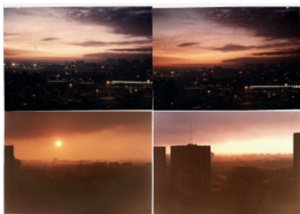
Doc. 3 – Capture d'écran de Tiers Livre, page dédiée à la genèse de Décor ciment .