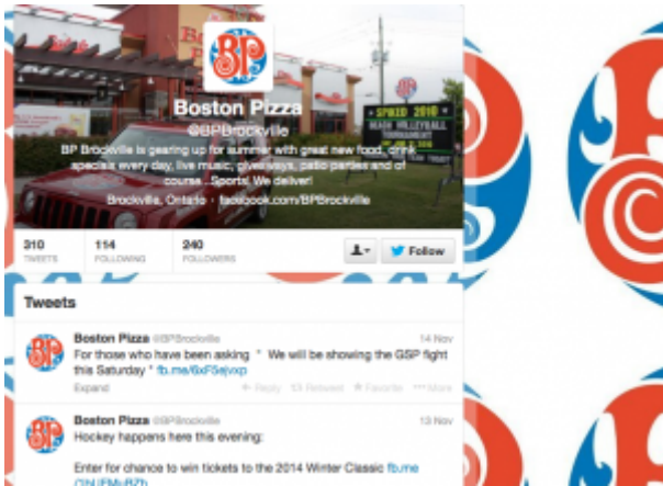
Doc. 5 – Capture d'écran du compte twitter de Boston Pizza @BP Brockville, novembre 2013.

dont il faut de toute urgence se saisir.