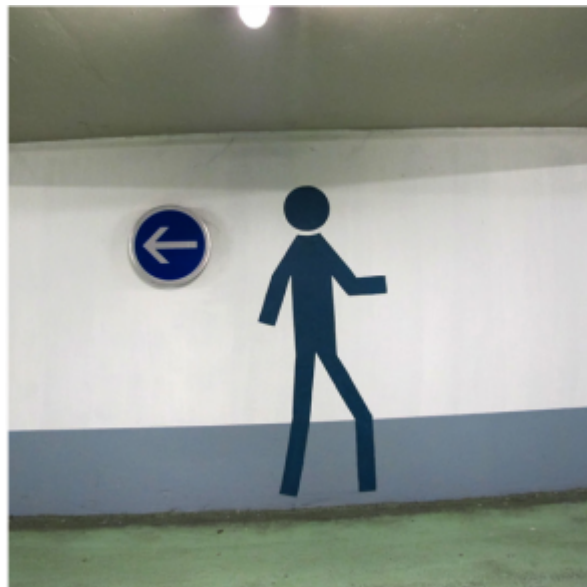
Doc. 8 - Capture d'écran de : François Bon, « carrés urbains | parking, Poitiers ». En ligne ici.