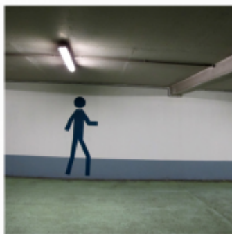
carrés urbains | parking, Poitiers

Le nomade tend à se réapproprier l'urbain en convertissant ses images en traces familières. Mais le montage de couloirs d'images étendus en longueur sur des pages au format imprévisible contribue également à métamorphoser la matière urbaine en support onirique, à partir duquel se perdre. Bon explique à plusieurs reprises ne pas avoir su trier ses photos, les redisant sans ordre, se fiant à la seule géométrie des images [48]. À ce désordre sémiotique correspond une politique de l'écriture-web. L'intermédialité libère un point de vue critique sur les bouleversements pathogènes qui affectent le paysage urbain. Le « petit journal » et les « carrés urbains » disent de manière privilégiée l'appauvrissement d'un monde, sa négativité, comme en témoignent les titres « maison qu'on tue », « fin d'un garage ». Aux maisons anciennes des livres de Balzac se substitue cet « étalement urbain banalisé de blocs cubiques trois étages [49] ». Les « fictions dans un paysage » imaginent également une ville dystopique, fondée sur le « on » interchangeable, le retour du même. La microfiction « photocopier les mondes » expose ce risque de l'uniformisation sous l'apparente revendication des différences [50]. La ville sillonnée en nomade menace le sujet d'une aliénation, d'une dépossession d'identité [51].