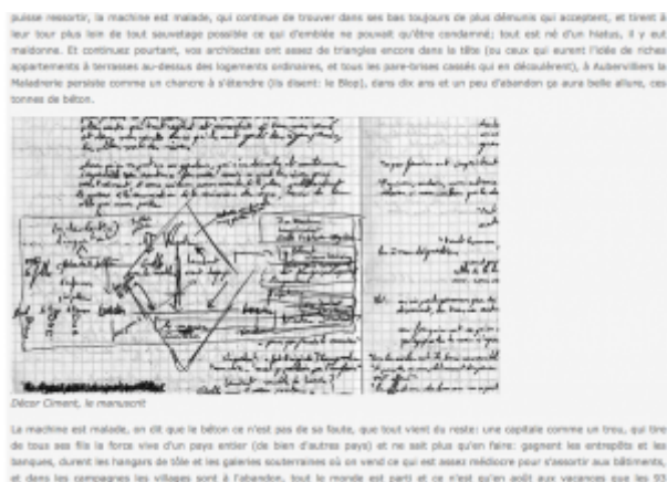
Doc. 2 – Capture d'écran de Tiers Livre, page dédiée à la genèse de Décor ciment .

Véritable plongée dans la genèse du texte, aperçu sur les carnets et sur les photos sépia de Bobigny, le lien propose également un article de l'écrivain publié par l'hebdomadaire Révolution en 1991.