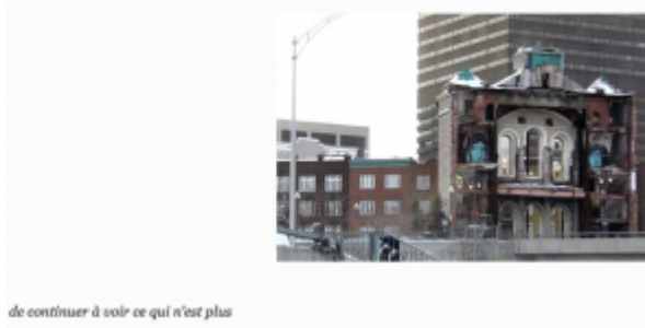
Doc. 6 – Capture d'écran de Tiers Livre, « Québec, adieux | 5, une démolition », en ligne ici.

La page s'ouvre sur une photo exposant le monument en ruines, se poursuit sur une chronique du séjour à Québec centrée sur le croisement entre l'ancien et le nouveau, l'église éventrée et l'autoroute toute-puissante. Dernier témoin du monument perdu, le texte multiplie les images d'une destruction, en intégrant une vidéo YouTube reproduisant en accéléré la mise en pièces du lieu sacré [47]. Par la multiplication des supports, des prises de vue et des prises de position sur la destruction du monument, la page dramatise moins l'événement lui-même que sa représentation, renouant avec la distanciation brechtienne à l'ère de l'intermédialité. La scénographie du chœur de la cité-chœur de l'église filmée et photographiée, chœur des voix dissonantes de Québec- colore d'étrangeté le paysage urbain familier des villes modernes. Outre le décalage France/Canada porté par le récit, la page offre des plans resserrés sur l'église ou l'écrase au contraire dans des plans éloignés, qui font ressortir la tour en arrière-plan et l'autoroute au premier-plan. La page se clôt sur une série d'images de l'église recadrée selon différents angles, formats, éclairages et distances.