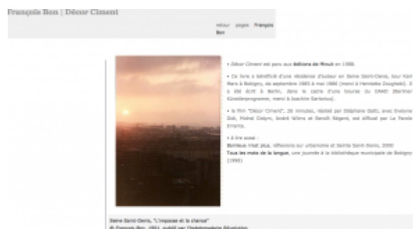
Doc. 1 – Capture d'écran de Tiers Livre, page dédiée à la genèse de Décor ciment .

ville ne saurait être abordée sans ces processus d'extraction ou de resémantisation de textes ensevelis, sciemment oubliés [18]. La remise en circulation de fragments, facilitée par le support numérique, arrache les extraits à leur contexte d'origine, Décor ciment , pour les retraverser au prisme de l'autobiographie, les documenter, les enrichir. Bon intègre une photo scannée aux fragments de Décor ciment et parsème son texte introducteur d'hyperliens aux fonctions diverses. Le premier renvoie au contexte dans lequel s'inscrit ce « retour sur Bobigny » : le projet « Une traversée de Buffalo ». Ce lien-bifurcation [19] mène à un autre parcours pluriel, divergent, dans la ville. Le lien suivant s'apparente davantage à une incise : si l'on clique sur les mots « il y a longtemps » s'affichent des éléments déposés par François Bon sur son site en 1998.