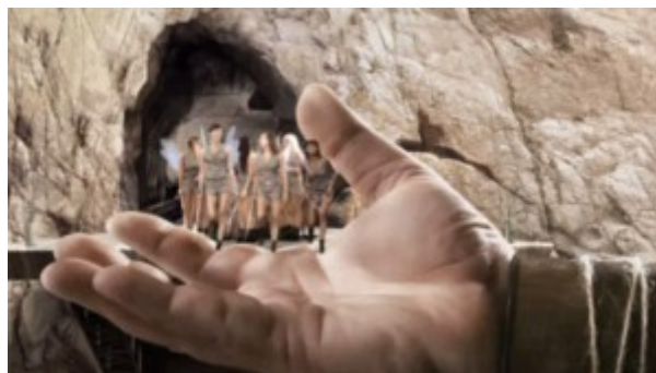
Doc. 4 : Image publicitaire © Bouygues