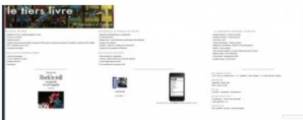
Doc. 6 – Page d'accueil de Tiers Livre, février 2009.