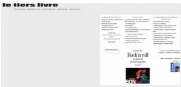
Doc. 5 – Page d'accueil de Tiers Livre, septembre 2008.