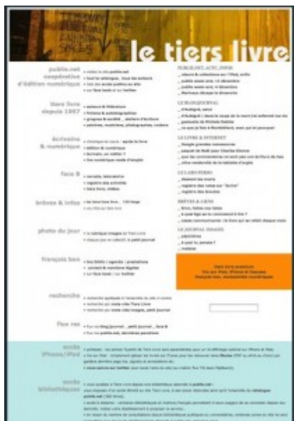
Doc. 9 – Page d'accueil de Tiers Livre, décembre 2010.