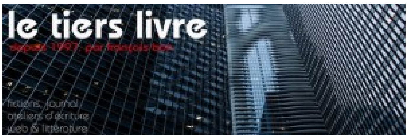
Doc. 1 – Page d'accueil de Tiers Livre, un des bandeaux de 2013.

On peut lire François Bon sur le web depuis 1997. C'est écrit sur la page d'accueil du site, comme un clin d'œil, comme l'affirmation d'une véritable expérience d'écriture.