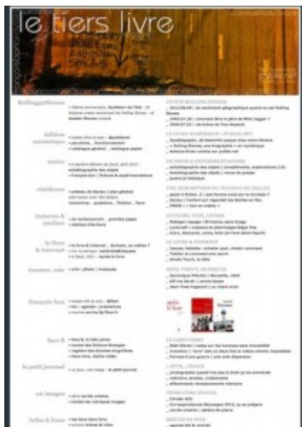
Doc. 12 – Page d'accueil de Tiers Livre, juillet 2012.