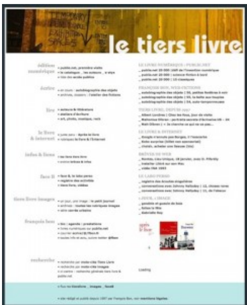
Doc. 11 – Page d'accueil de Tiers Livre, décembre 2011.