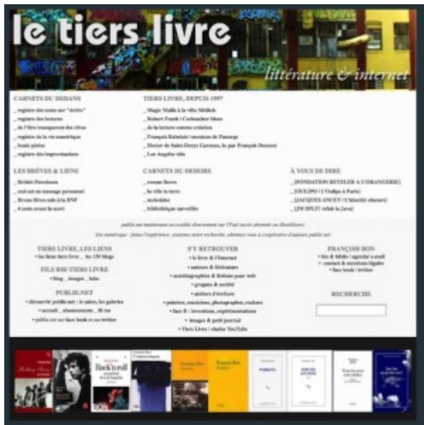
Doc. 8 – Page d'accueil de Tiers Livre, juin 2010.