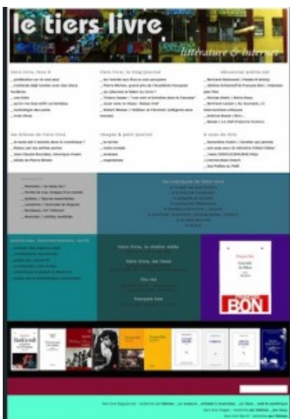
Doc. 7 – Page d'accueil de Tiers Livre, novembre 2009.