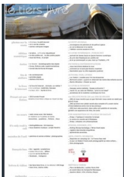
Doc. 13 – Page d'accueil de Tiers Livre, décembre 2012.