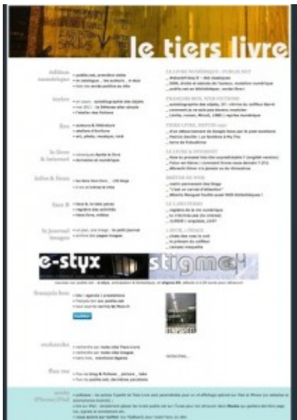
Doc. 10 – Page d'accueil de Tiers Livre, juin 2011.