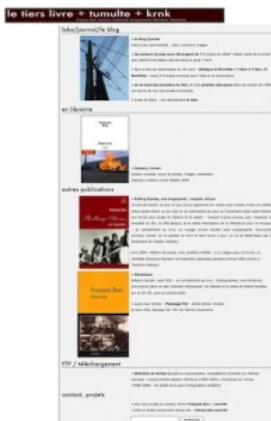
Doc. 2 – Page d'accueil de Tiers Livre, avril 2005.

D'où cette tension entre verticalité et horizontalité... Historiquement, le site bouge sa page d'accueil, casse ses marges, s'étire par les côtés. La fonction horizontale contrarie la logique verticale. C'est le premier renversement de lecture. Pour voir ce renversement de la verticalité par l'horizontalité et le foisonnement intérieur, il suffit de parcourir l'histoire des pages d'accueil depuis 2005. Ci-dessous 13 images des pages d'accueil entre avril 2005 et octobre 2013