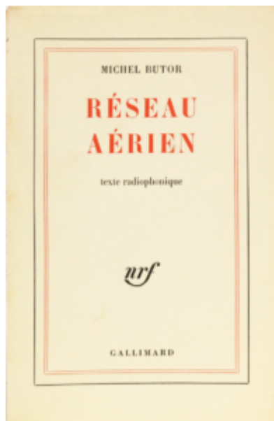
Doc. 3 – Michel Butor, Réseau aérien , texte radiophonique, Paris, Gallimard, 1962.