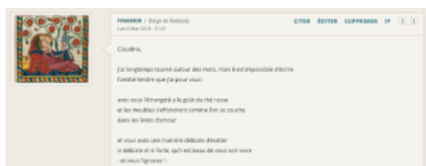
Doc. 4 – Capture d'écran du forum FINAMOR.