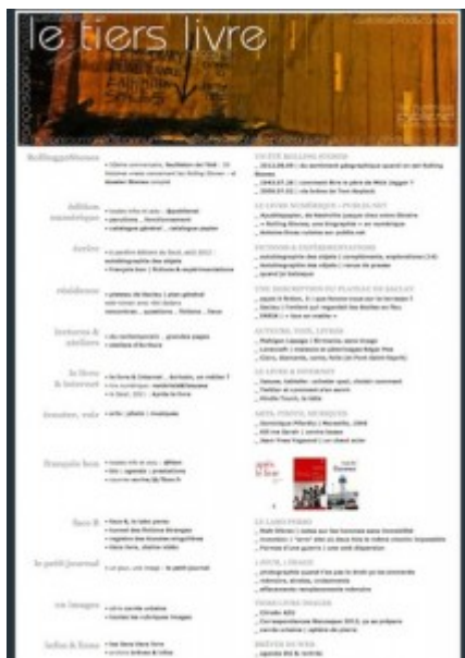
Doc. 12 – Page d'accueil de Tiers Livre, juillet 2012.