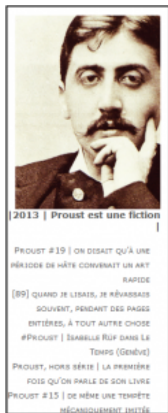
Doc. 4 - Capture d'écran du menu de droite présent dans les billets de la section « |2013| Proust est une fiction| » de Tiers Livre, le 30 novembre 2013.

Dans le sommaire, en plus des liens vers les cent fragments, nous pouvons trouver des « hors-série, images & compléments » qui offrent des billets informant sur le contexte d'écriture de Proust est une fiction ou sur les expériences subséquentes, comme la visite de la maison d'Illiers-Combray. À l'intérieur des billets, la navigation impose soit de retourner en arrière vers le sommaire grâce au navigateur, soit d'utiliser les boutons précédent ou suivant [25].