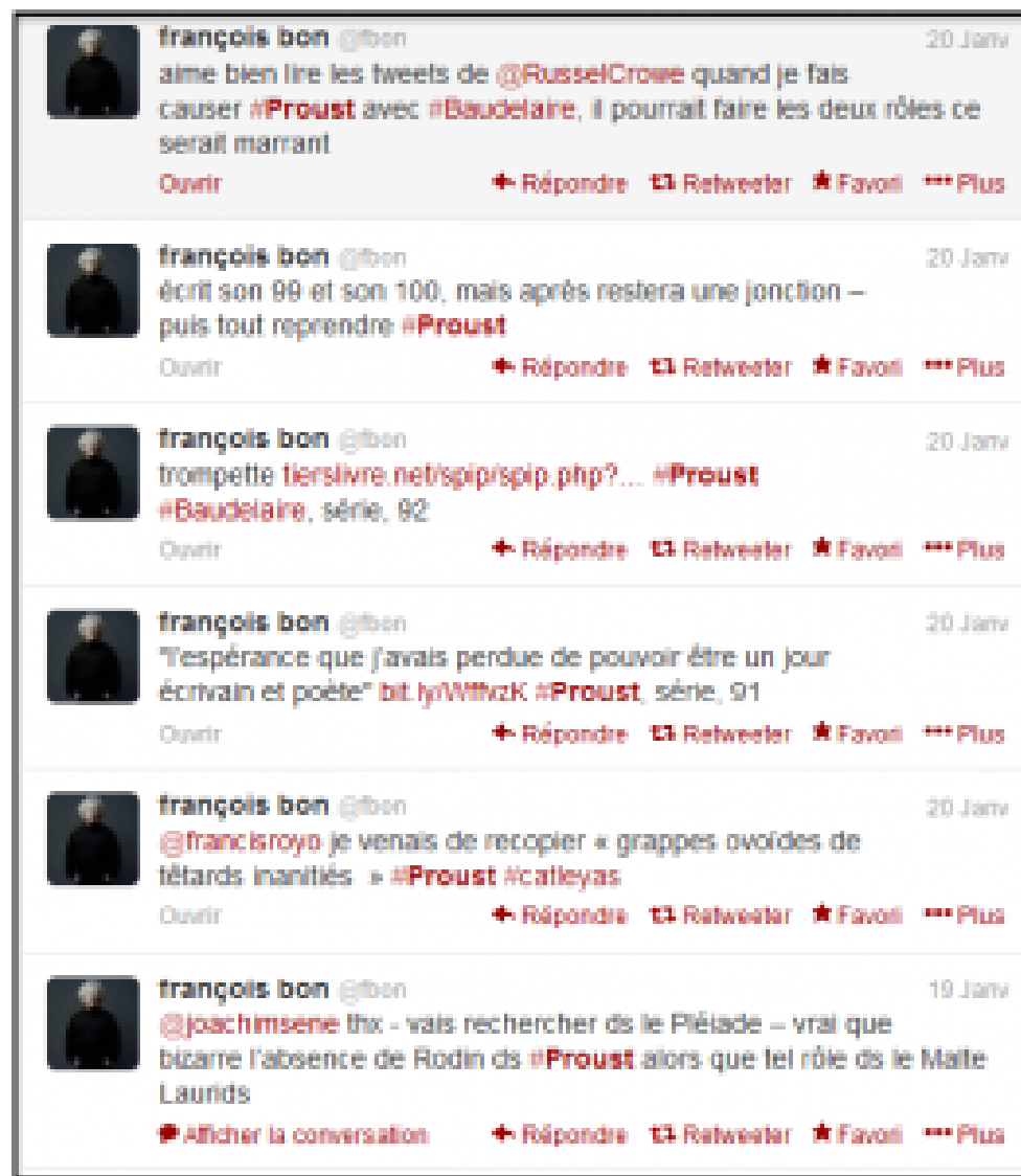
Doc. 5 - Capture d'écran des publications des 19 et 20 janvier 2013 sur le compte Twitter @fbon, réalisée le 30 novembre 2013.

Cette poétique du nœud , de l'interstice , pour reprendre le vocabulaire de Gefen, caractérise bien l'expérience proposée dans Proust est une fiction , puisque celle-ci se développe dans le dialogue avec et entre les lecteurs, entre les textes au sein du site, mais aussi entre les médias (le site, le livre, les réseaux sociaux). Pendant toute la durée de l'expérience [32], le fil Twitter était présent en bordure de chaque billet sur Tiers Livre en même temps que sur le compte Twitter @fbon, les messages de Bon faisaient (et font toujours) sans cesse des liens vers le site, dans un dialogue transmédiatique incessant.