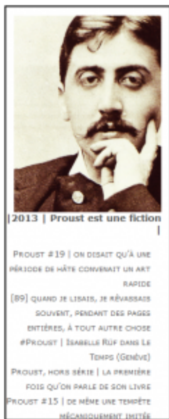
Doc. 4 - Capture d'écran du menu de droite présent dans les billets de la section « |2013| Proust est une fiction| » de Tiers Livre, le 30 novembre 2013.

Dans le sommaire, en plus des liens vers les cent fragments, nous pouvons trouver des « hors-série, images & compléments » qui offrent des billets informant sur le contexte d'écriture de Proust est une fiction ou sur les expériences subséquentes, comme la visite de la maison d'Illiers-Combray. À l'intérieur des billets, la navigation impose soit de retourner en arrière vers le sommaire grâce au navigateur, soit d'utiliser les boutons précédent ou suivant [25].