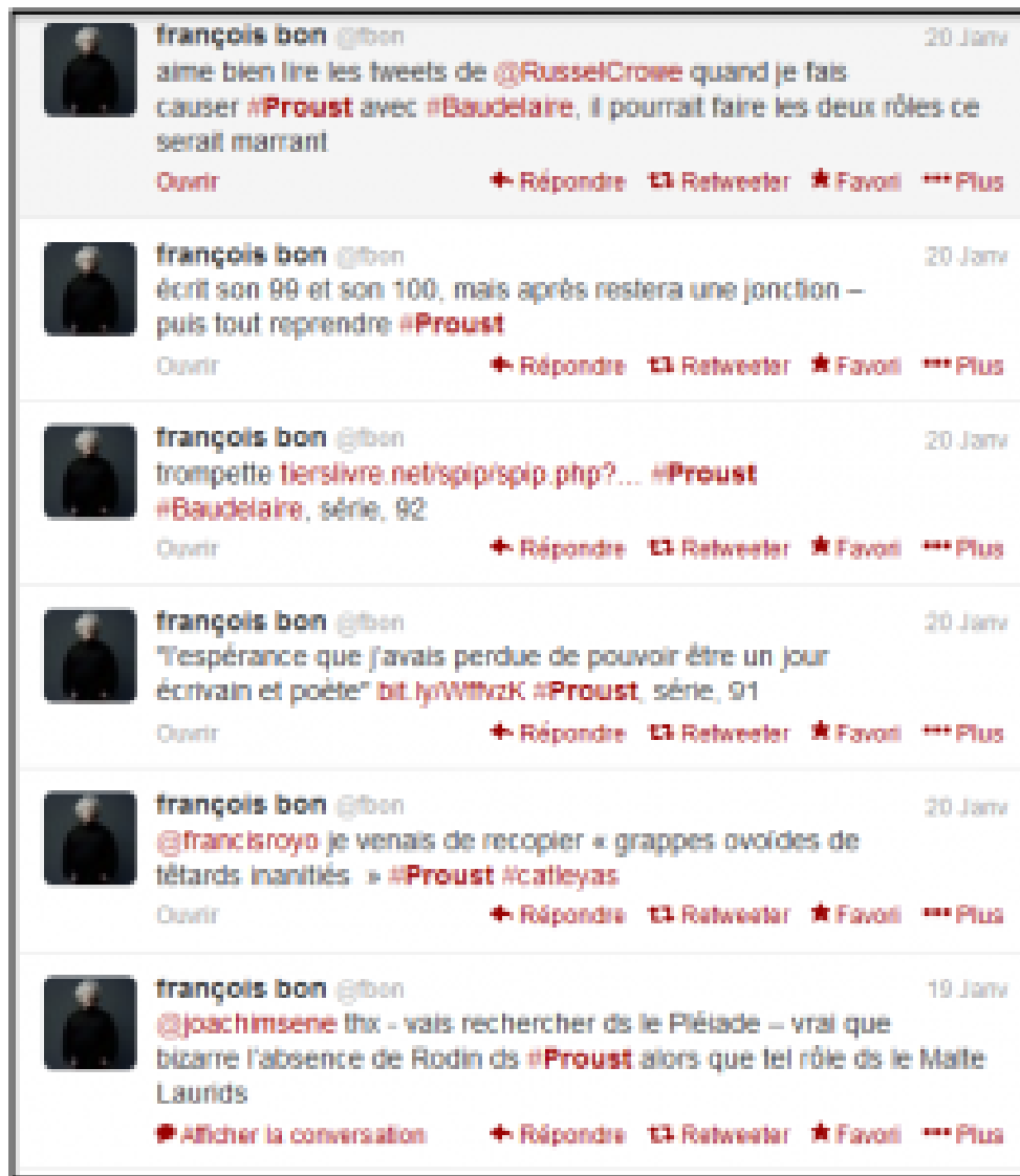
Doc. 5 - Capture d'écran des publications des 19 et 20 janvier 2013 sur le compte Twitter @fbon, réalisée le 30 novembre 2013.

Cette poétique du nœud , de l'interstice , pour reprendre le vocabulaire de Gefen, caractérise bien l'expérience proposée dans Proust est une fiction , puisque celle-ci se développe dans le dialogue avec et entre les lecteurs, entre les textes au sein du site, mais aussi entre les médias (le site, le livre, les réseaux sociaux). Pendant toute la durée de l'expérience [32], le fil Twitter était présent en bordure de chaque billet sur Tiers Livre en même temps que sur le compte Twitter @fbon, les messages de Bon faisaient (et font toujours) sans cesse des liens vers le site, dans un dialogue transmédiatique incessant.