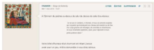
Doc. 23 – Capture d'écran du forum FINAMOR.

Le lecteur s'insinue jusque dans la diégèse poétique ; ce n'est pas là une attitude inédite sur le forum, où nombre de retours sur les poèmes s'effectuent sous forme de textes poétiques à fonction critique, voire corrective. Le topic prolonge cette conversation sur sept poèmes, et rend compte de la complexité de l'intrication des systèmes d'adresse et de réponse sur les topics polylogaux de forum, où les citations de messages précédents viennent clarifier les choses, comme dans ce poème qui cite entre guillemets et en italiques un poème placé deux messages plus haut, mais qui pourtant est adressé à l'énonciateur d'un poème placé encore plus haut :