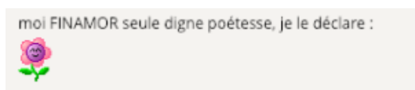
Doc. 5 – Capture d'écran du forum FINAMOR.

– FINAMOR comme personnage distinct : tous les poèmes ne contenant ni biographèmes ni indices de l'identité du scripteur ou du destinataire sont par défaut des poèmes assumés par FINAMOR, comme sujet lyrique universel. Parmi eux, une sous-catégorie raffine le procédé en donnant des biographèmes assimilables à FINAMOR comme personnage, ou en introduisant la signature dans le corps du texte, comme c'est le cas ici :