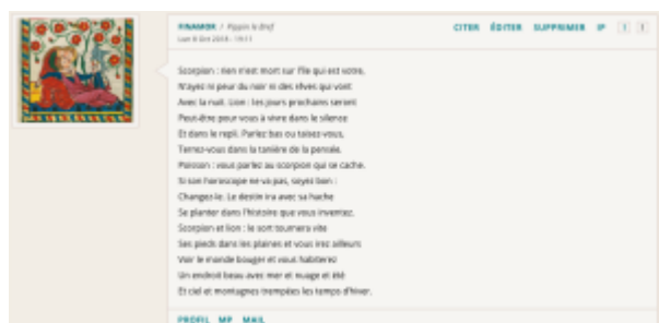
Doc. 15 – Capture d’écran du forum FINAMOR.

parole poétique. Plusieurs poèmes s’amusent de cette attente et la mettent au carré, comme le font trois poèmes d’horoscope parus entre le 8 octobre et le 3 novembre 2018 :