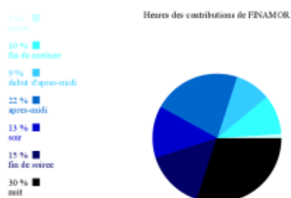
Doc. 8 – Graphique des heures des contributions de FINAMOR.

Deux types d'indices chroniques renforcent la fiction d'auteur FINAMORienne : la date et l'heure de ses publications, ainsi que son rythme de publication. Les membres du forum contribuent doublement à la légende nocturne qui entoure la poétesse : en postant effectivement ses poèmes dans la nuit (lorsqu'ils en sont scripteurs), et en commentant la teneur nocturne de l'aura de la poétesse :