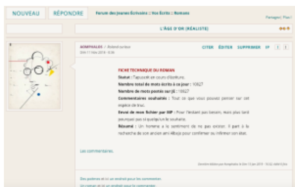
Doc. 17 – Capture d'écran du forum FINAMOR.

Les romanciers de la plateforme ont par exemple stabilisé le premier post de tout topic consacré à un roman, à tel point que la norme est devenue prescriptive (contenue dans le règlement de la section romans, et donc obligatoire pour tout nouveau membre). En voici un exemple :