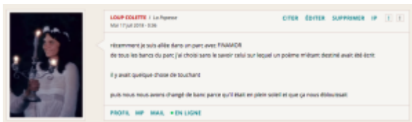
Doc. 3 – Capture d'écran du site FINAMOR.