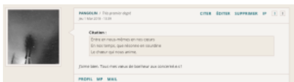
Doc. 24 – Capture d'écran du forum FINAMOR.

valeurs clef est la solaz , ce divertissement qu'on met en œuvre par la capacité à vivre en contexte courtois, avec politesse, en menant une conversation agréable et dans le respect d'autrui [39]. Ce polissage des rapports n'est pas sans rappeler l'injonction qui est faite aux lecteurs de FINAMOR : « Il y a des commentaires, mais on ne juge ni le style ni rien ici : on dit juste "c'est mignon, c'est beau, merci beaucoup, je suis tout·e troublé·e, voyons-nous demain, je t'aime aussi d'amour tendre, buvons-nous un thé" ou des trucs comme ça. » Au sein de l'espace du forum, la critique n'est pas tendre, et c'est bien un portrait en négatif de la critique ordinaire que dessinent ces interdits. L'espace des commentaires de FINAMOR fait figure d'îlot de douceur et d'aménité, et la lecture comme les commentaires de ses textes forment une véritable parenthèse courtoise dans le jeu des interactions ordinaires. La rhétorique courtoise est donc prise en charge par les lecteurs :