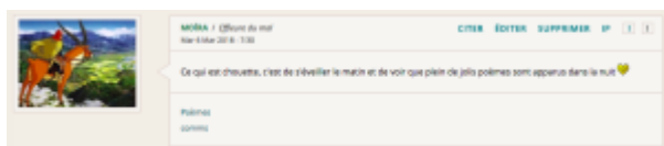
Doc. 9 – Capture d'écran du forum FINAMOR.

On voit sur ce graphique que presque la moitié des contributions de FINAMOR a été postée la nuit (entre 22 heures et 6 heures du matin), ce qui est une moyenne remarquablement haute relativement aux usages en vigueur dans la section poésie du forum. Cette légende est alimentée par les commentaires de membres :