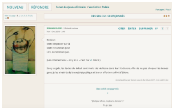
Doc. 18 – Capture d'écran du forum FINAMOR.

– la tendance minimaliste, où le post se compose d'un simple lien vers les commentaires :