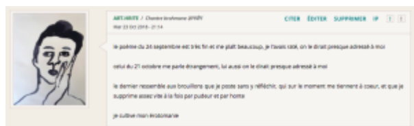
Doc. 16 – Capture d’écran du forum FINAMOR.

Ce petit jeu n’est d’ailleurs pas réservé aux seuls poèmes ; il faut que les lecteurs entrent en scène pour que la mystification prenne corps, comme le fait art.hrite en feignant de se découvrir seul bénéficiaire de tous les poèmes, pastichant discrètement l’érotomanie lectoriale :