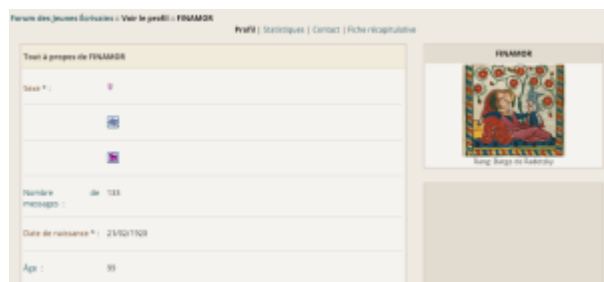
Doc. 1 – Capture d'écran du forum FINAMOR.

De fait, FINAMOR est genrée au féminin : première entorse à l'imaginaire médiéval de l'amour courtois, dans lequel les trobairitz [10] occupent censément une place de second plan. Elle a 99 ans, âge canonique pour une poétesse médiévale, et son avatar représente une enluminure ambiguë : dans ce couple d'amoureux tendrement enlacés, qui de l'homme ou de la femme détient la parole poétique ?