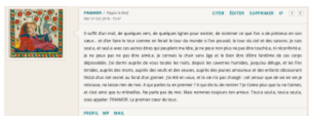
Doc. 6 – Capture d'écran du forum FINAMOR.

– FINAMOR comme énonciateur lyrique collectif : cette utilisation est apparue plus tardivement, comme si elle était le fruit d'un imaginaire de FINAMOR qui avait eu besoin de sédimenter pour donner aux scripteurs des idées plus raffinées du personnage. Ce chant d'amour à plusieurs voix se matérialise dans des textes où le « je lyrique » s'écrit en langue inclusive :