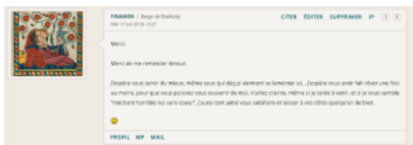
Doc. 26 – Capture d'écran du forum FINAMOR.

Lire les pages de commentaires peut même s'avérer lassant ; quand les lecteurs ne s'exclament pas devant la beauté des poèmes, ils se disent touchés, ou feignent d'être les récipiendaires des poèmes. FINAMOR vient même leur répondre :