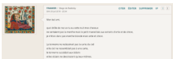
Doc. 21 – Capture d'écran du forum FINAMOR.

C'est à partir du 29 juillet 2018 que s'enclenche un véritable polylogue poétique, prenant pour point d'appui un poème lyrique très classique dans sa situation d'énonciation : un énonciateur masculin hétérosexuel déclare sa flamme à une destinataire féminine, à l'aide de force métaphores convenues. Les cheveux de la muse, « amie grave et légère », sentaient « la menthe fraîche et la nuée d'orage » tandis que, marqueur temporel, « le tonnerre redessina la carte du ciel » ; la femme dansait « une Valse de Shostakovich en descendant du lit ». Tout cela enveloppe la situation de brumes romantico-surréalistes qu'un poème posté la nuit suivante vient dissoudre en les aplanissant :