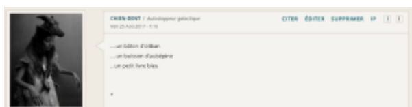
Doc. 20 – Capture d'écran du forum FINAMOR.

FINAMOR n'exploite pas cette hétérogénéité médiatique, mais le même type de rapport existe cependant entre les posts qui composent son fil : on peut parler, grâce à la diversité des contributeurs, d'une hétérogénéité stylistique, thématique et énonciative. Mais cette hétérogénéité, plutôt naturelle dans le cadre d'un projet collectif au sein duquel les textes pris individuellement ne sont pas écrits à plusieurs, se double de jeux d'échos et de renvois, qui réinstaurent une forme de polylogue dans le topic. Là où les écrivains du forum avaient produit des topics qui bannissaient cette forme de conversation, FINAMOR réintroduit dans la section bibliothèque du forum la possibilité d'une dialogue entre textes. Nous avons déjà abordé le topos de la signature et les poèmes hypertextuels. Existente aussi les reprises et modulations d'images poétiques ; le 1 décembre 2018, FINAMOR insère dans un poème : « vous parlez si bien de mon buisson d'aubépine », et le 4 janvier 2019, dans un autre : « c'est une adorable personne qui a dans son jardin un buisson d'aubépine ». Ce motif est d'ailleurs une réponse au topic « Orbes » de chien-dent, où il est installé parmi d'autres objets de rituel :