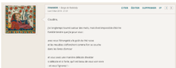
Doc. 4 – Capture d'écran du forum FINAMOR.