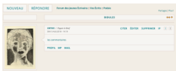
Doc. 19 – Capture d'écran du forum FINAMOR.

– la tendance minimaliste, où le post se compose d'un simple lien vers les commentaires :