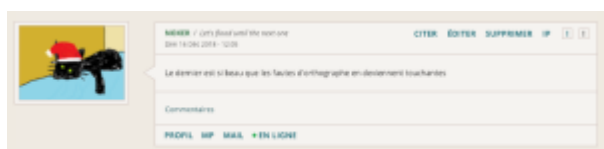
Doc. 25 – Capture d'écran du forum FINAMOR.

Lire les pages de commentaires peut même s'avérer lassant ; quand les lecteurs ne s'exclament pas devant la beauté des poèmes, ils se disent touchés, ou feignent d'être les récipiendaires des poèmes. FINAMOR vient même leur répondre :