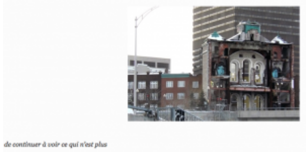
Doc. 6 – Capture d'écran de Tiers Livre, « Québec, adieux | 5, une démolition », en ligne ici.

La page s'ouvre sur une photo exposant le monument en ruines, se poursuit sur une chronique du séjour à Québec centrée sur le croisement entre l'ancien et le nouveau, l'église éventrée et l'autoroute toute-puissante. Dernier témoin du monument perdu, le texte multiplie les images d'une destruction, en intégrant une vidéo YouTube reproduisant en accéléré la mise en pièces du lieu sacré [47]. Par la multiplication des supports, des prises de vue et des prises de position sur la destruction du monument, la page dramatise moins l'événement lui-même que sa représentation, renouant avec la distanciation brechtienne à l'ère de l'intermédialité. La scénographie du chœur de la cité-chœur de l'église filmée et photographiée, chœur des voix dissonantes de Québec- colore d'étrangeté le paysage urbain familier des villes modernes. Outre le décalage France/Canada porté par le récit, la page offre des plans resserrés sur l'église ou l'écrase au contraire dans des plans éloignés, qui font ressortir la tour en arrière-plan et l'autoroute au premier-plan. La page se clôt sur une série d'images de l'église recadrée selon différents angles, formats, éclairages et distances.