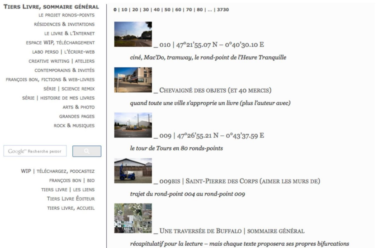
Doc. 2 - Poétique de la titraille, entre underscore et pipe .

Cette sémiotique de la titraille met ainsi en évidence les liens entretenus entre les éléments reliés (les mots-clefs entre eux, l'image et le titre), les rapports d'appartenance. Au sein d'un site dense,